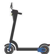
特定小型原動機付自転車のイメージ図