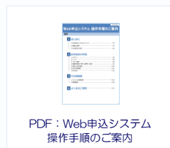
PDF: Web申込システム 操作手順のご案内