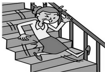
階段から落ちてケガ