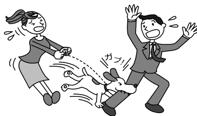
飼い犬が他人にケガを負わせた