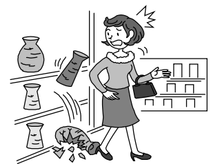
買い物中に商品を壊してしまった