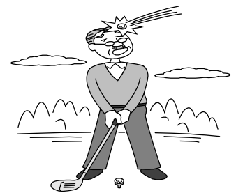
スポーツ中のケガ